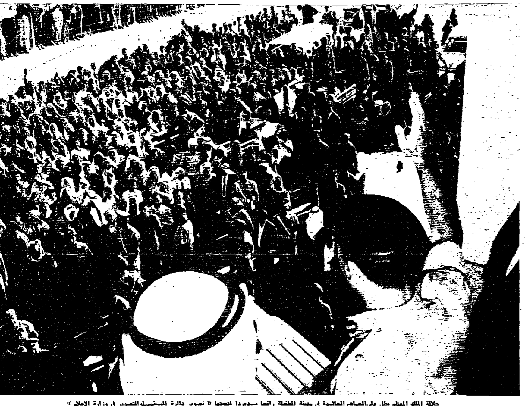
جلالة الملك العظيم يطل على الجماهير الحاشدة في مدينة الطفيلة رافعا يدهمدا لتحياتها

عمان - واء - تابع جلالة الملك العظيم جولته التقدية في مختلف أنحاء المملكة فأبصر جلالة سحابة يوم امس في لقاء أبناء أسرته الأردنية فسي قضاه ملحا ومحافظة الكرك في مادبا وقد منح جلالة في هذه الجولة سمو الامير حسن ولي العهد العظيم ودولة السيد بهجت القلوي رئيس الوزراء وعدد من الوزراء وعلى طول الطريق التي مر بها الملك